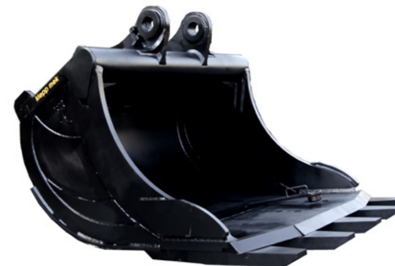
Heavy Duty lasteskuffer