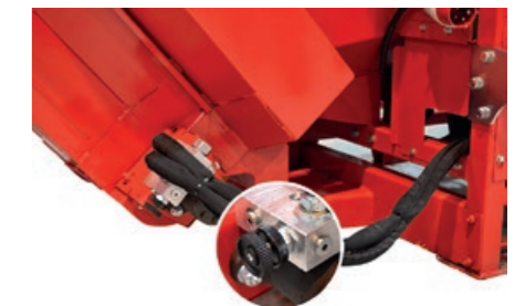
Hastighetskontroll for transportør er standard.