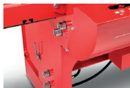
Tillkoplingssett for stokkbord er tilleggsutstyr.