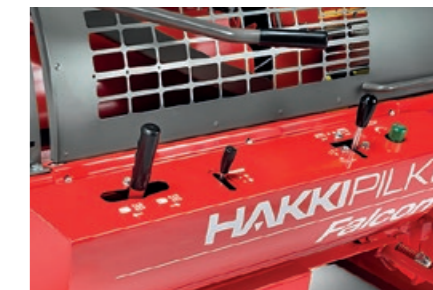
Ergonomisk og brukervennlig kontrollpanel gjør maskinen enkel å betjene.