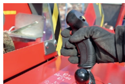
Elektrisk kontroll av kapping og kløyving med bare to knapper.