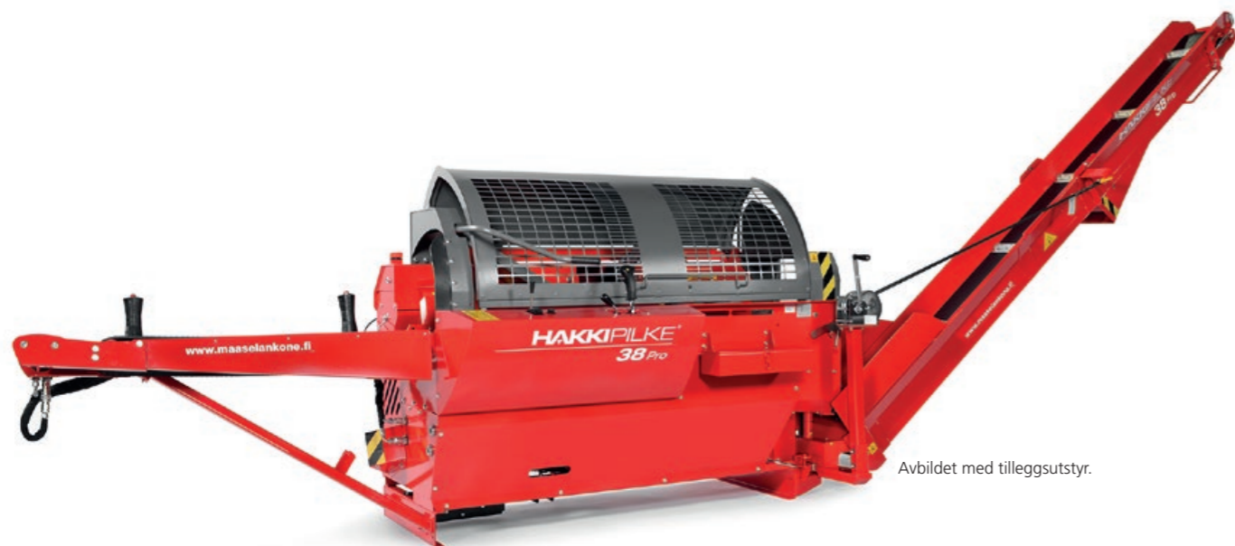
Avbildet med tilleggsutstyr.

Hakki Pilke 38 Pro gir deg enestående effektivitet under vedbehandling. En enkel, ergonomisk og effektiv Hakkicut™-kappekontroll lar deg kappe med et enkelt trykk på en joystickknapp. Under kapping blir senkehas-tigheten til sagsverdet automatisk tilpasset etter motstanden, hvilket sikrer en effektiv og rask prosess. Med en kløyvekraft på 10 t, kan 38 Pro kløyve selv det hardeste av tre, og oppnår en kløyvesyklus på maksimum 3 sekunder.