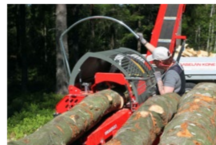
Maskinens hydraulikk muliggjør bruk av flere funksjoner samtidig med enspaksbetjening.