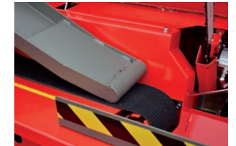
Stokkeholder og belte med ru flate.