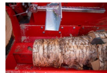
38 Pro har en halvtaktsfunksjon for å gjøre kløyveprosessen av kort ved raskere. Halvtaktsfunksjon styres enkelt med en knapp i frontpanelet.