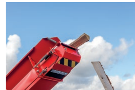
Transportør med flisutskiller gir renere ved.