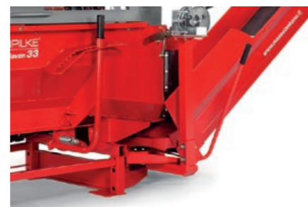
Svingbar transportør og flisutskiller er standard.