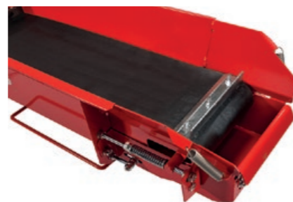
Patentert rensende transportør er standard. Spalten i enden av transportbåndet separerer avfallet fra veden.