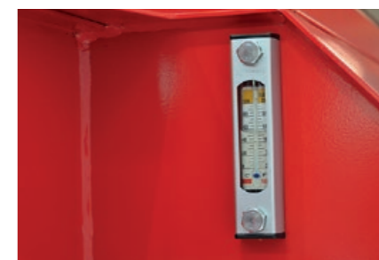
Stor oljetankkapasitet og nivåglass.