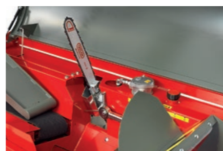
Effektiv hydraulisk kapping.