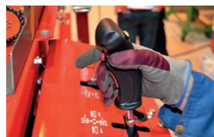
Et enestående brukergrensesnitt som lar deg behandle ved med bare to knapper.