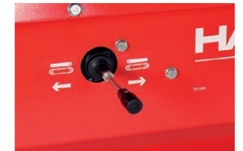
Reversventilen for innmatingsbåndet er standard.