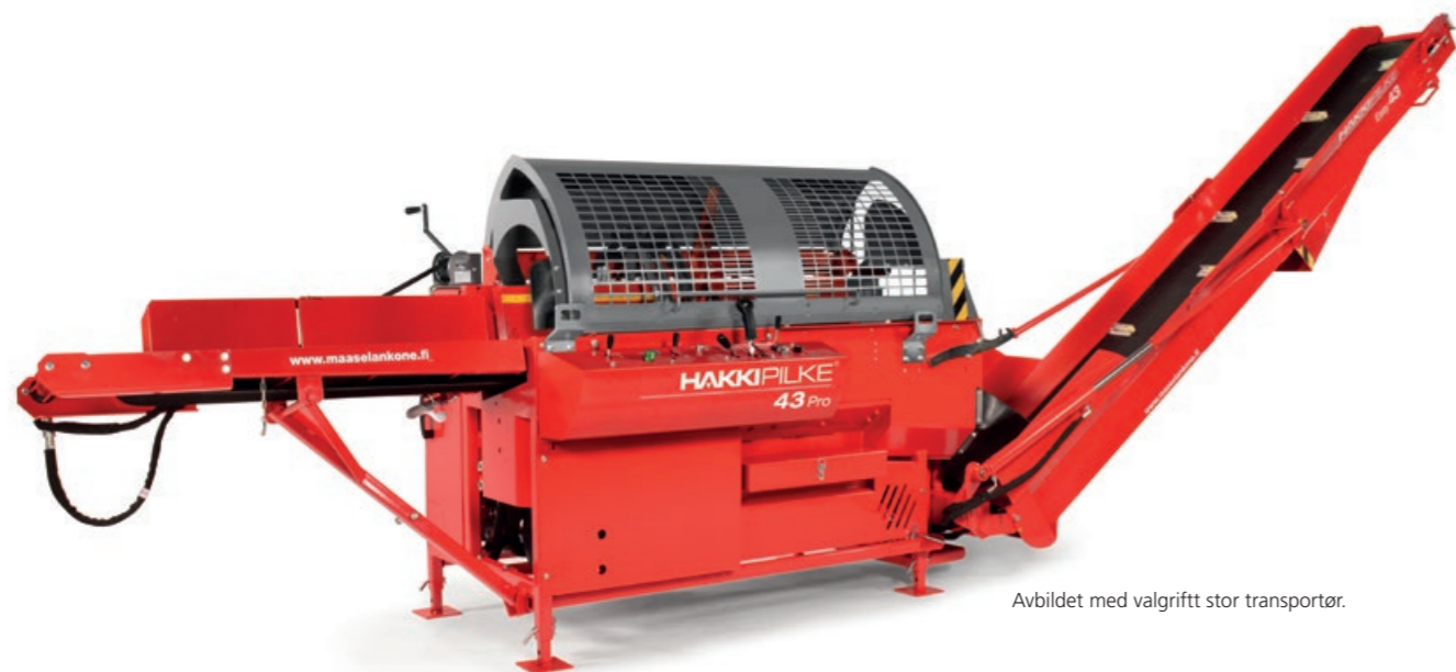
Avbildet med valgrifft stor transportør.

Hakki Pilke 43 Pro er en helt unik vedmaskin anbefalt av profesjonelle brukere. Maskinens produktivitet har blitt forbedret med HakkiSplit™ -kløyvemekanismen samt nye funksjoner som sikrer uavbrutt materialflyt – en hydraulisk stokkeholder, hydraulisk vedlengde måler og kubbelandingsplater. Hvis maskinen hovedsakelig brukes til å behandle store stokker eller produsere ved av betydelig størrelse, kan kjøpere gå for en bredere transportør.