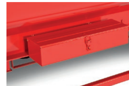
Praktisk verktøyboks som standard.